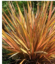
> PHORMIUM tenax Feuillage orange / 120 cm Persistant