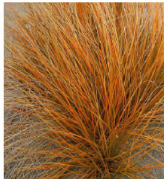
> CAREX Testacea Graminé orange / 60 cm Persistant